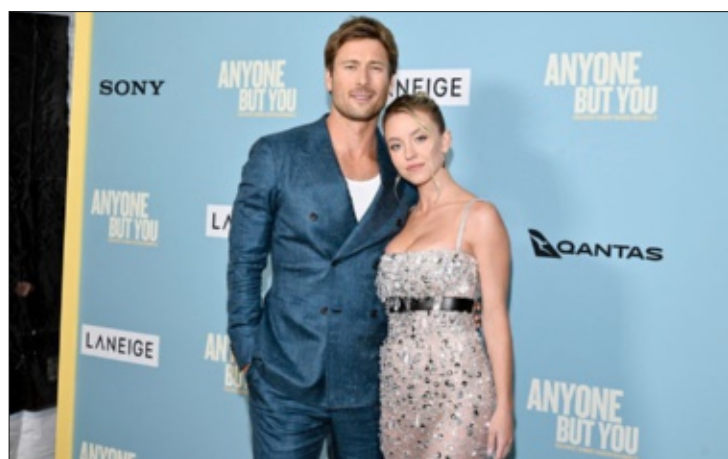
Glen Powell [t.v.] og Sydney Sweeney har hovedrollene i den romantiske komedien «Anyone but you». Her på premieren i New York.

40-årene er man ung som filmkomponist. Det er et fag man må samle erfaring i. Prøv å ikke bare tenke film, men også TV-serier, teater og alle mulige varianter hvor man bruker musikk for å fortelle en historie. For det er det det handler om, historiefortelling.