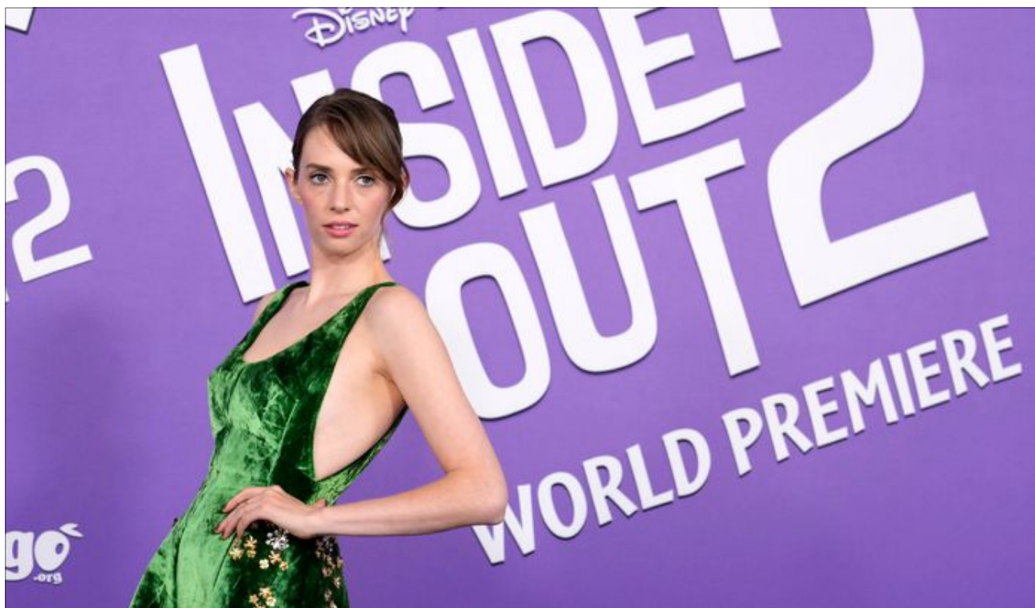
Maya Hawke har en av stemmene i «Innsiden Ut 2», som var den best besøkte filmen på norske kinoer i helgen.

- Vi lever av et godt og attraktivt innhold på våre kinoer. Denne våren har det vært langt mindre attraktivt innhold enn hva som er normalt. Det kan blant annet forklares med streiker i Hollywood både blant skuespillere og manusforfattere,